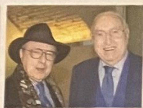
Da sinistra Pingitore e Pippo Baudo