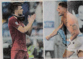
Roma, solita emergenza contro il Borussia M. La Lazio sfida il Celtic nella bolgia di Glasgow

Torna domani l'Europa League con due impegni difficili per le squadre della Capitale: Roma-Borussia Moenchengladbach (sono attesi 6.000 tifosi tedeschi, una parte arriverà già oggi: è allarme per l'ordine pubblico) e Celtic Glasgow-Lazio. In regalo con l'edizione romana del Corriere della Sera, domani, un inserto di 16 pagine sulle due partite. a pagina 13