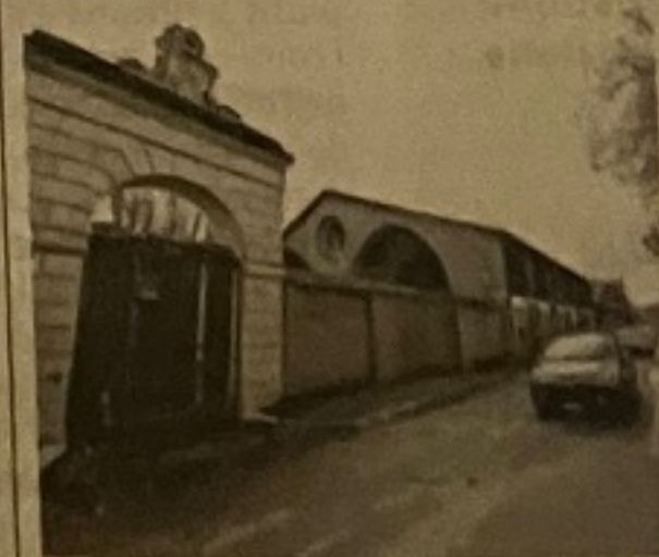
L'ex Arsenale pontificio di Porta Portese, ospiterà la Quadriennale